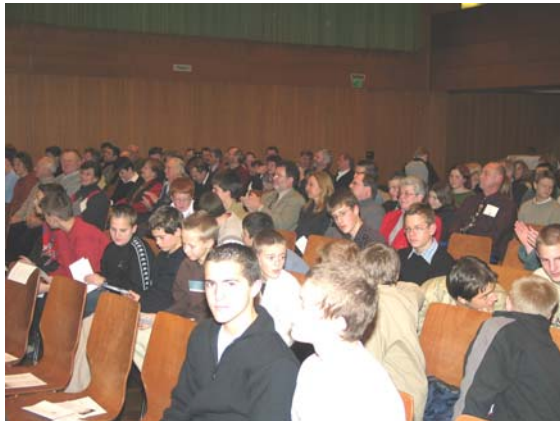
Zahlreiche Zuschauer verfolgten den Ehrungsabend

umrahmten den Ehrungsabend mit anspruchsvollen Vorträgen einschließlich eingeforderter Zugabe