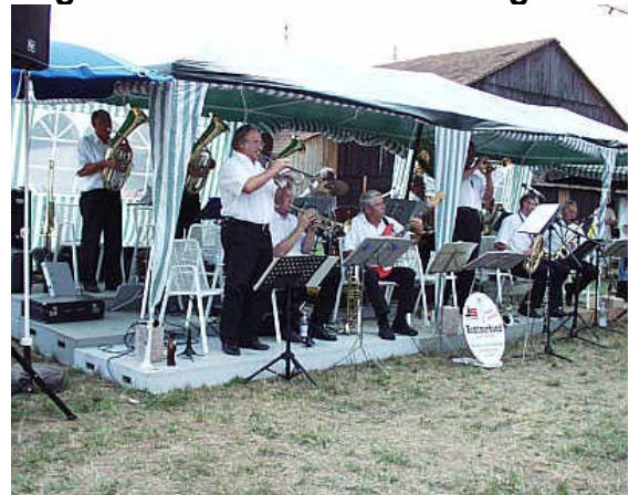
Die Rentnerband umrahmte das Sägwerkfest

Am Freitag, 08. August fand das diesjährige, inzwischen bereits traditionelle Sägwerkfest des Fanfarenzuges Iffezheim statt. War das Sägwerkfest letztes Jahr wegen des strömenden Regens buchstäblich ins Wasser gefallen und hatte in einer Gummistiefelfete geendet, so meinte es Petrus dieses Jahr besonders gut mit den Iffezheimer Fanfarenbläsern. Tagsüber Sonne satt, und als sich am Abend einige Wölkchen breit machten, stürmten die Iff'zer zum alten Sägwerk.