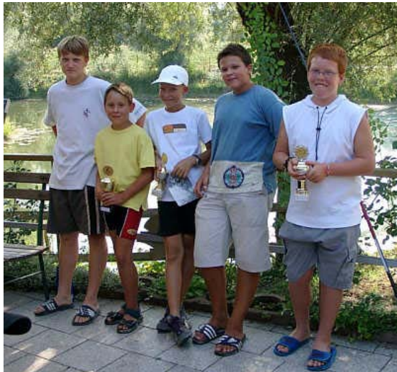
Erfolgreiche Kinder bei der AKI