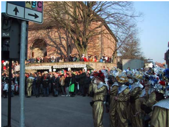
Zahlreiche Iff'zer beobachteten dieses Spektakel.

„Fleischkiechle“- die eigentlich für den hungrigen Elfenrat bestimmt waren – gegönnt zu haben.