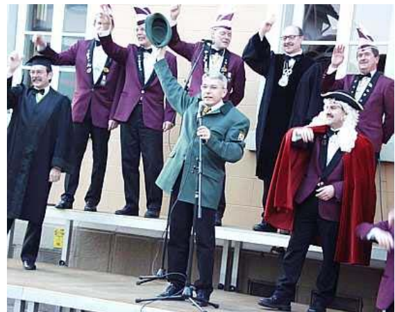
Das Narrengericht des ICC mit Bürgermeister

hauses am „Schmutzigen Donnerstag“, 27.02.2003 in ihre Gewalt brachten.