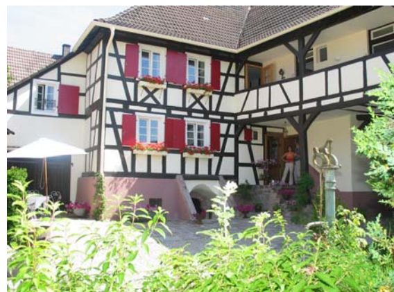
Idyllischer Innhof des Hotels nach der Renovierung

Zum Frühjahrs-Meeting 2003 ist eines der ältesten Gebäude Iffezheims vom Dornröschenschlaf erwacht. Seit 1995 stand das Gast-