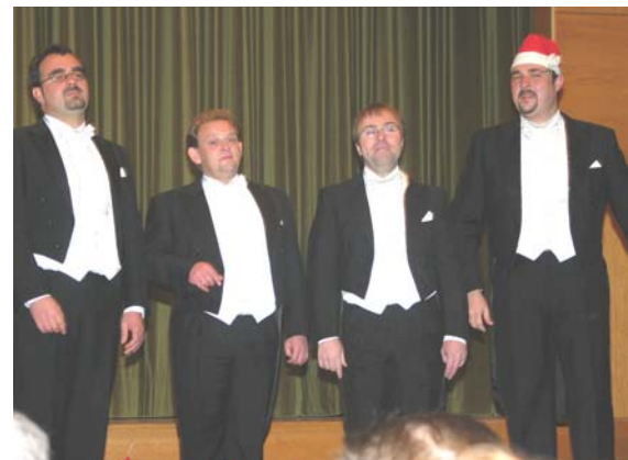
Das Karlsruher Männerquartett "Barbershop Sixpack"