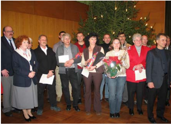
Geehrte Blutspenderinnen und Blutspender

Insgesamt 18 Blutspenderinnen und Blutspender konnte der Bürgermeister für 10, 25, 50