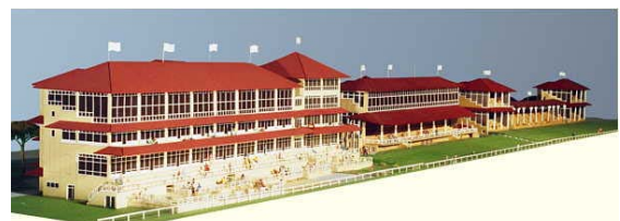
Modell der geplanten Tribüne

Der Gemeinderat hat am Montag, 17.03.2003 dem Abriss der alten und dem Bau der neuen Tribüne zugestimmt. Architekt Alwin Merkel, dessen Stil seit 1986 die Rennbahn prägt, stellte den Ratsmitgliedern und der Öffentlichkeit die eingereichte Planung vor.