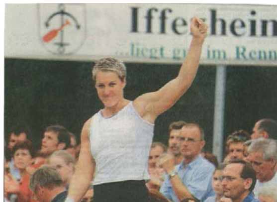
Die strahlende Siegerin Astrid Kumbernuss