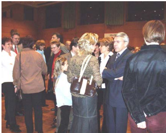
Anregende Gespräche in der Festhalle

Das neue Jahr begann mit einem Novum in der Gemeinde Iffezheim. Der Neujahrsempfang fand am Neujahrstag nicht –wie gewohnt– vormittags statt, sondern wurde auf den späten Nachmittag verlegt. Erstmals waren zu diesem offiziellen Ereignis alle Bürgerinnen und Bürger eingeladen. Über 300 Gäste nutzten die Gelegenheit, sich in ungezwungener Atmosphäre zu begegnen und sich für das Neue Jahr Glück zu wünschen.