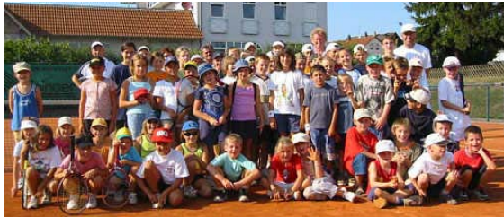
Kinderspaß beim Tennisclub

Allen örtlichen Vereinen mit ihren Aktiven, die durch ihr ehrenamtliches Engagement Jahr für Jahr zum Gelingen des Kinderspaßes in Iffezheim beitragen, möchten wir an dieser Stelle unseren Dank aussprechen.