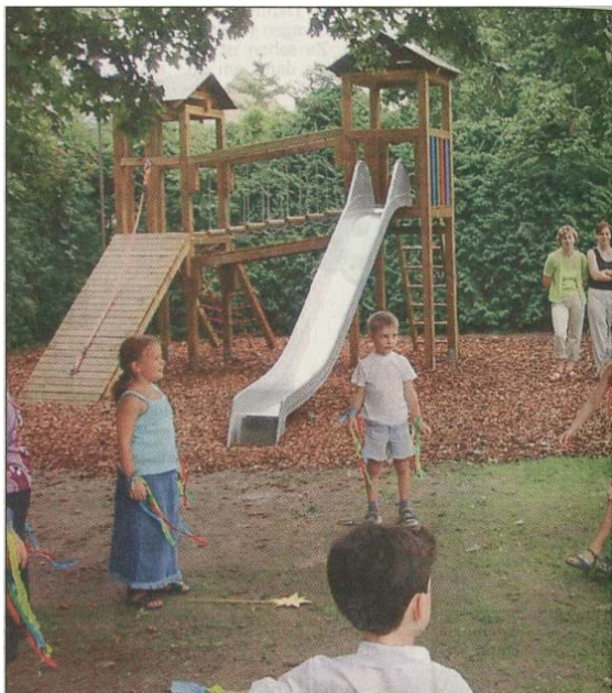
Kindergarten St. Christopherus in der Rennbahnstraße