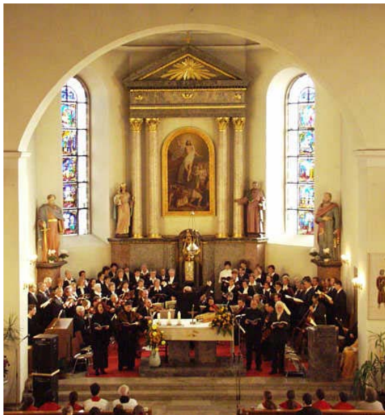
Paukenmesse am 23. November

Nach dem abschließenden „Halleluja“ spendeten die begeisterten Gottesdienstbesucher stehenden Beifall.