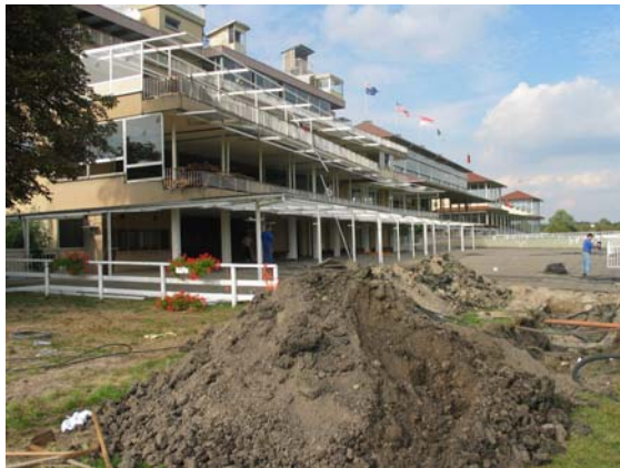
Die alte Clubplatztribüne hat ausgedient

Der Bauauftrag für den mit 10,2 Millionen Euro veranschlagten Neubau einer Tribüne auf der Galopprennbahn Iffezheim blieb in der Region.