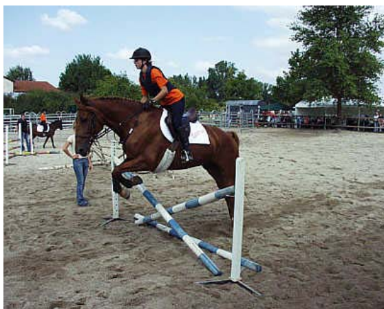
Tag der offenen Tür des Reit- und Rennvereins

Aufgrund des Neubaus der Bénazet-Tribüne musste in diesem Jahr das Bauernrennen