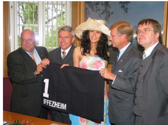
Neue Satteldecke ab dem Frühjahrsmeeting 2003

Zum Frühjahrs-Meeting 2004 soll der 10,2 Millionen Euro teure Tribünen-Neubau fertig gestellt sein. Mit diesen Vertragsvereinbarungen können sich sowohl der Internationale Club als auch die Gemeinde Iffezheim als Gewinner betrachten. Schließlich wollen wir alle, dass die Internationalen Pferderennen auf sehr hohem Niveau auch weiterhin Bestand haben.