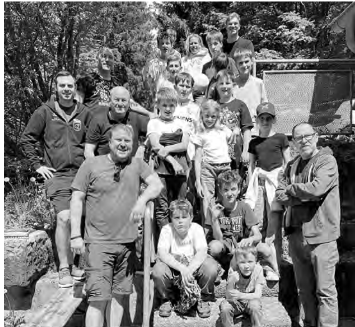
Gruppenfoto unserer Hütt-Gang

Es war für die Kinder als auch für die erwachsenen Betreuer eine Riesengaudi. Im Außenbereich gab es einen tollen Fußballplatz als auch zwei schöne Tischtennisplatten, damit man nicht in Trainingsrückstand gerät. Ein großes Highlight war der Spaziergang zu Wibkes Homebase, der Startplatz der Gleitschirmflieger. Der Ausblick war einfach nur magisch, als auch die Mountainbike-Strecke wurde von den Kids etwas zweckentfremdet.