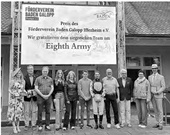
Siegerehrung zum Preis vom Förderverein Baden Galopp Iffezheim e. V.

Im Anschluss an den Donnerstags-Renntag fand unter dem Motto „Galopp meets Skat“ im Waagegebäude unser Skattturnier statt. 60 Skatspieler aus der Region und ganz Turf-Deutschland spielten um die Wette. Der Erlös kam unserem Förderverein zugute.