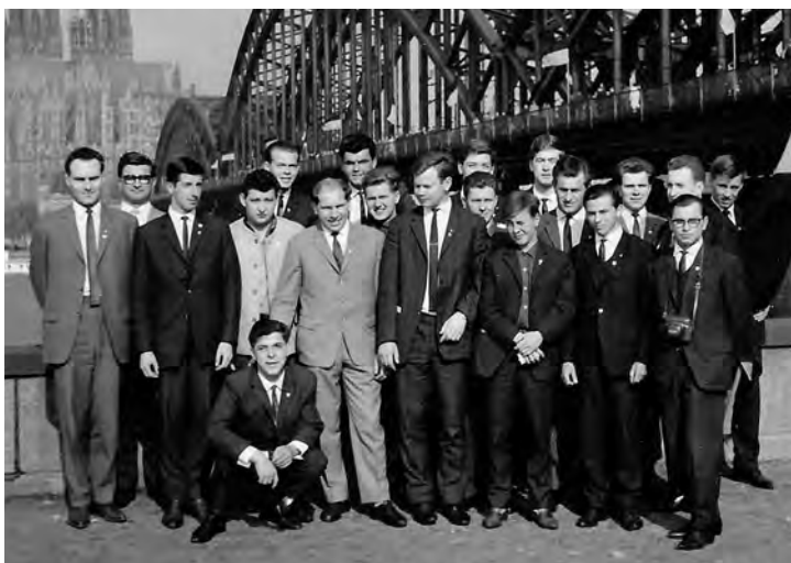
Ausflug der Iffezheimer Kolpinger zum „Internationalen Kolpingtag“ nach Köln im Jahr 1965. Erst ein Jahr später konnten Mädchen und Frauen „offiziell“ Mitglieder im Kolpingwerk Deutschland werden.

Die Kolpingkasse der Iffezheimer erfreute sich dadurch einer Einnahme, die nur dem Ortsverein zur Verfügung stand. Folge dieses damaligen „Versteckspiels“ ist, dass bis heute bei einem Jubiläum die betroffenen Frauen für weniger Jahre Mitgliedschaft geehrt werden, als ihnen inoffiziell anzurechnen sind. Man macht heute wie damals kein großes Aufheben um diese Formalie. Und seit 1978 ist für Frauen und Mädchen auch in Iffezheim die reguläre Mitgliedschaft beim Kolping-Zentralverband üblich. Im Kolpingwerk Deutschland wird die Zahl weiblicher Mitglieder auf 30% angegeben. In der bundesweiten Kolpingjugend sind es längst 50%. Ein Verhältnis was sich so ziemlich genau auch in der jüngsten Gruppe der Kolpingsfamilie Iffezheim, der Leiterrunde, wiederfindet.