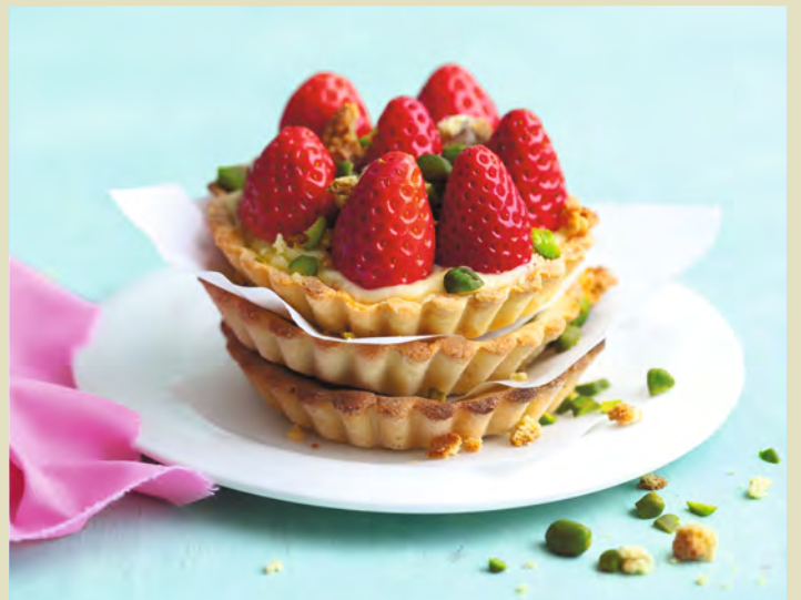
txn. Vanilletartelettes mit frischen Erdbeeren dürfen auf keinem Sommerfest fehlen.

fernen. Die Eigelbmasse unter ständigem Rühren in die Milch geben, diese erneut aufkochen. Creme in eine Schale füllen und zum Abkühlen gelegentlich umrühren. Butter unterziehen. Die Erdbeeren waschen und putzen. Die Pistazienkerne fein hacken. Cantuccini grob zerbröseln und mit Pistazien mischen. Die Böden aus der Form lösen und mit Crème füllen. Erdbeeren mit den Spitzen nach oben dicht an dicht daraufsetzen, mit Pistazien bestreuen und servieren.